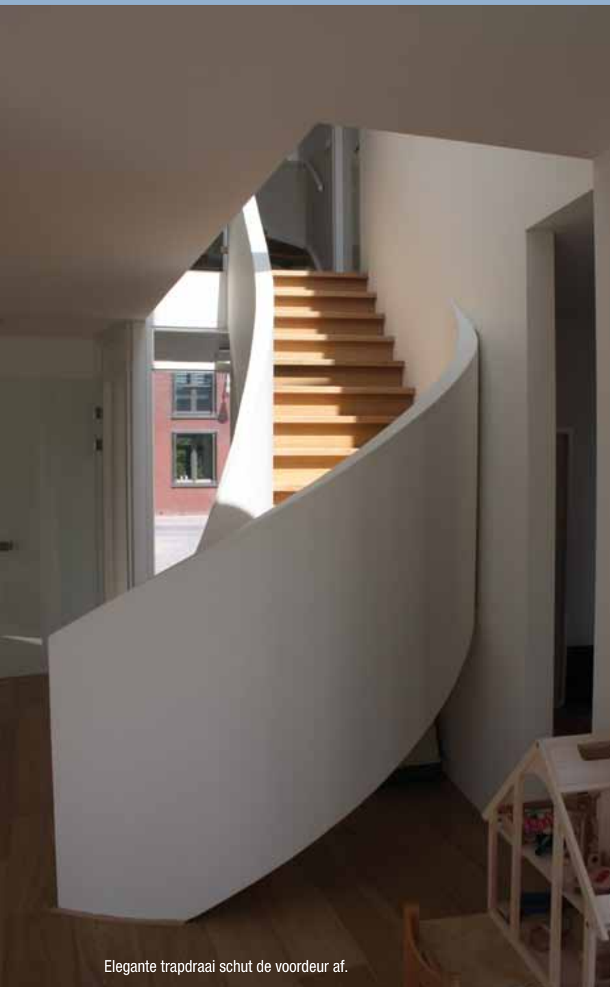
Elegante trapdraai schut de voordeur af.