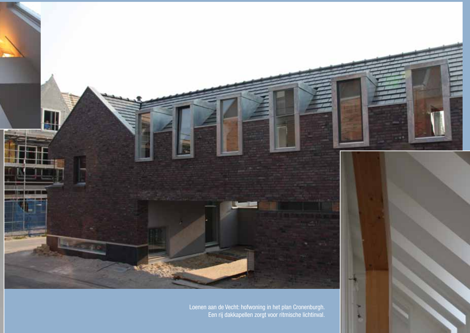
Loenen aan de Vecht: hofwoning in het plan Cronenburgh. Een rij dakkapellen zorgt voor ritmische lichtinval.