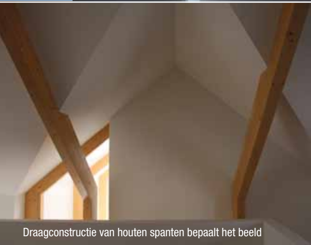
Draagconstructie van houten spanten bepaalt het beeld