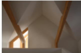
Materiaal en constructie