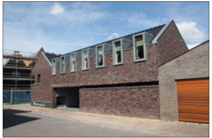
Hoeviewoning special Cronenburgh Loenen aan de Vecht