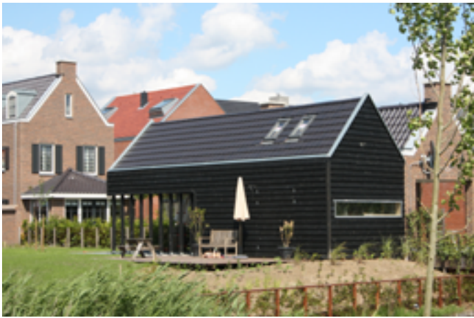
landelijke houten schuur