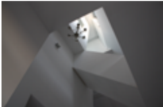
Licht en ruimte