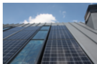
Integratie duurzame installaties

Is die functionele indeling eenmaal geoptimaliseerd, dan wordt er scherp gekeken naar de haalbaarheid én naar de esthetische mogelijkheden. Zo ontstaat uiteindelijk een ruimtelijk interieur met een samenspel van zichtlijnen, openheid, daglicht en mogelijkheden tot contact.