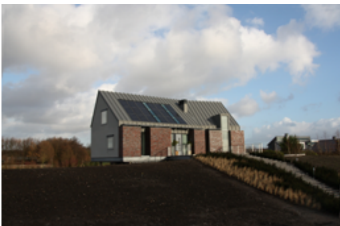
Villa Almere Overgooi

Het ontwerp van een woning is een subtiel samenspel tussen de wensen van de opdrachtgever, de gegeven locatie en het bouwbudget . De vertaling en combinatie van deze drie zaken zorgt elke keer weer voor een uniek resultaat .