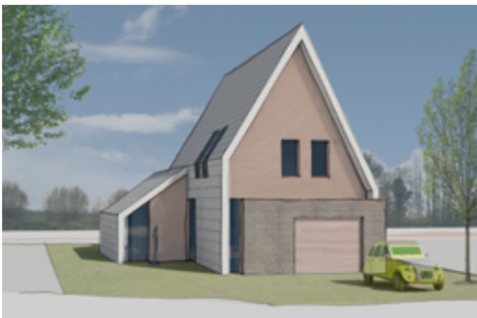
Voorbeeld woning: keuken en woonkamer aan tuinzijde