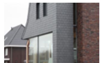
Combinatie natuurlijke materialen